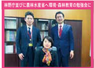
林野庁並びに農林水産省へ環境・森林教育の勉強会に