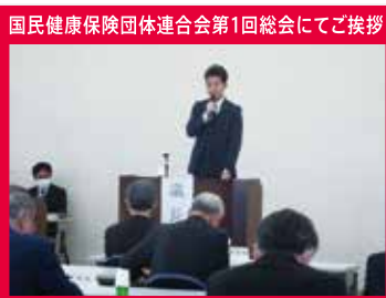
国民健康保険団体連合会第1回総会にてご挨拶