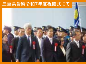
三重県警察令和7年度視閲式にて