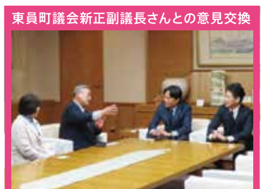
東員町議会新正副議長さんとの意見交換