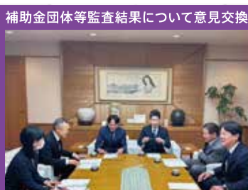
補助金団体等監査結果について意見交換