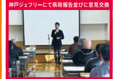
神戸ジェフリーにて県政報告並びに意見交換