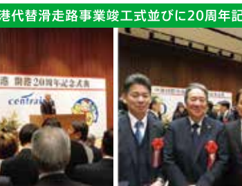
中部国際空港代替滑走路事業竣工式並びに20周年記念式典に参加