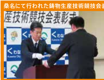
桑名にて行われた鋳物生産技術競技会表彰式に出席