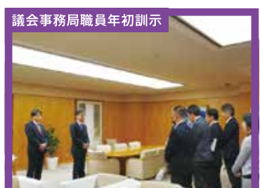
議会事務局職員年年初訓示