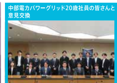
中部電力パワーグリッド20歳社員の皆さんと 意見交換