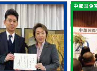
東員町議会新正副議長さんとの意見交換