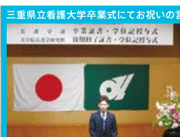
三重県立看護大学卒業式にてお祝いの言葉を