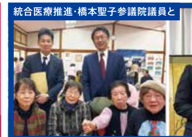
統合医療推進・橋本聖子参議院議員と 意見交換