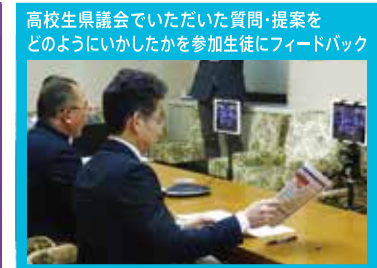
高校生県議会でいただいた質問・提案を どのようにいかしたかを参加生徒にフィードバック