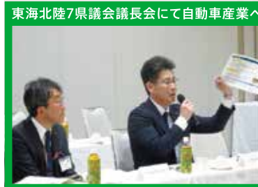
東海北陸7県議会議長会にて自動車産業への支援拡充を要望