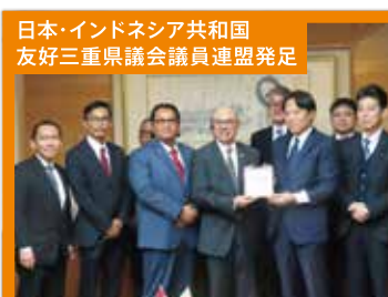
日本・インドネシア共和国 友好三重県議会議員連盟発足