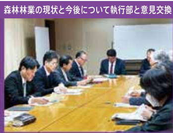
森林林業の現状と今後について執行部と意見交換