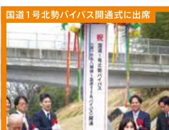
国道1号北勢バイパス開通式に出席