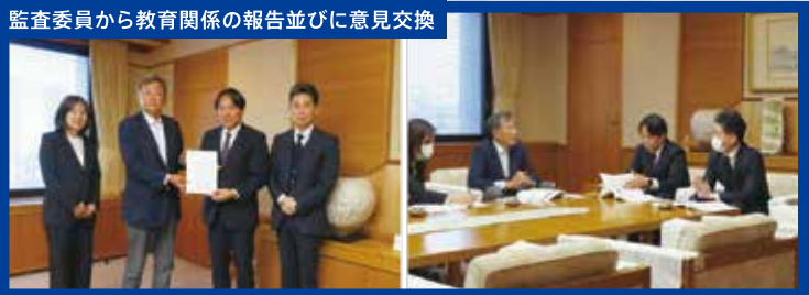
監査委員から教育関係の報告並びに意見交換