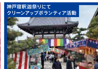
神戸寝釈迦祭りにて クリーンアップボランティア活動