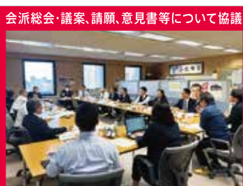
会派総会・議案、請願、意見書等について協議