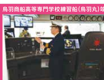
鳥羽商船高等専門学校練習船(鳥羽丸)竣工式並びに内覧会に出席