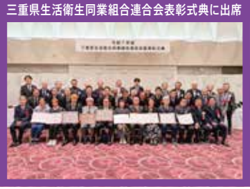
三重県生活衛生同業組合連合会表彰式典に出席