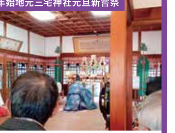
年始地元三宅神社元旦新嘗祭