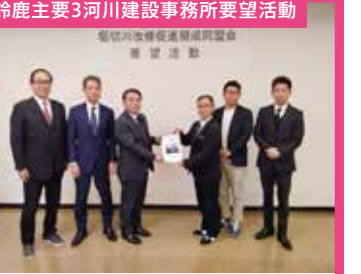
鈴鹿主要3河川建設事務所要望活動