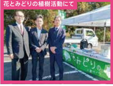
花とみどりの植樹活動にて