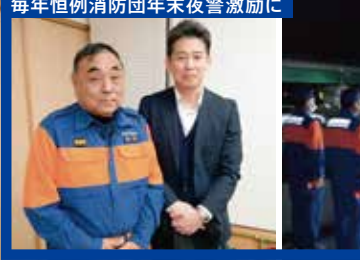
毎年恒例消防団年末夜警激励に