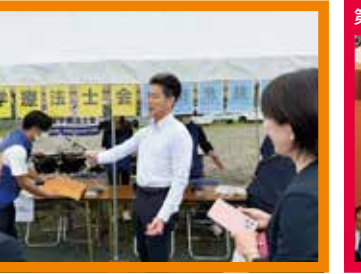
第61回三重県私学大会に参加