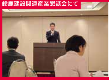
鈴鹿建設関連産業懇話会にて