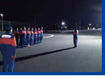
年末恒例神戸神社にて