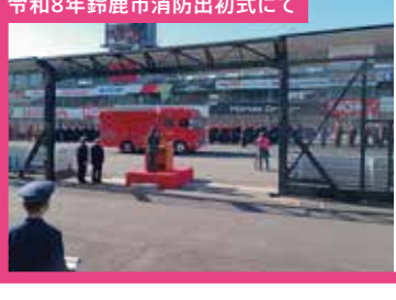
令和8年鈴鹿市消防出初式にて