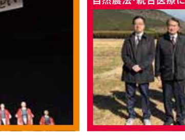
自然農法・統合医療についての県外調査