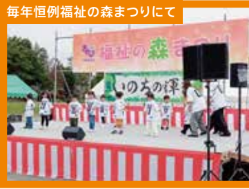
毎年恒例福祉の森まつりにて