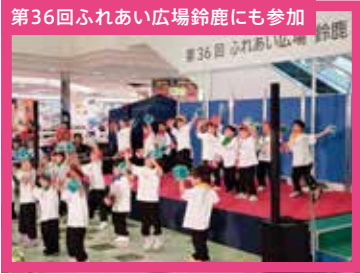
第36回ふれあい広場鈴鹿にも参加

最新の情報はこちらをチェック! https://www.facebook.com/masato.kobayashi.9421