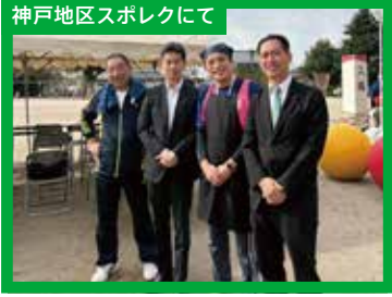
神戸地区スポレクにて