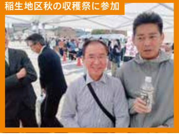
稲生地区秋の収穫祭に参加