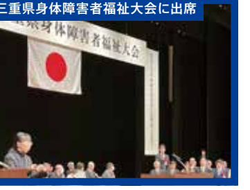
三重県身体障害者福祉大会に出席