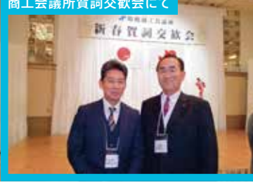
商工会議所賀詞交歓会にて