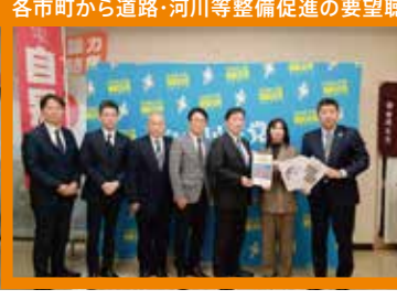
各市町から道路・河川等整備促進の要望聴き取り