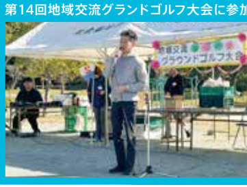
第14回地域交流グランドゴルフ大会に参加