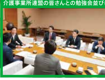
介護事業所連盟の皆さんとの勉強会並びに意見交換