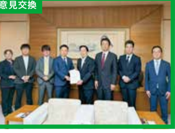
三重県議会インドネシア友好議員連盟副会長として