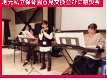
地元私立保育園意見交換並びに懇談会