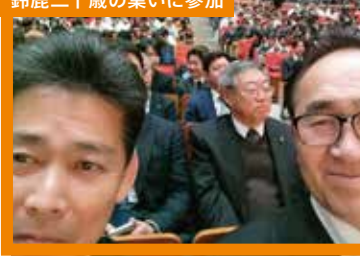
鈴鹿二十歳の集いに参加